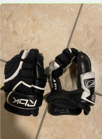
Handschuhe Reebok, Größe 9", mit kleinem Loch am Daumen, für 5 Euro abzugeben 13:27 ✓